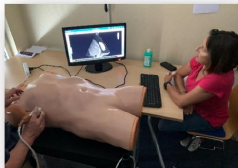
Pathologies sur simulateur haute-fidélité Vimedix®.