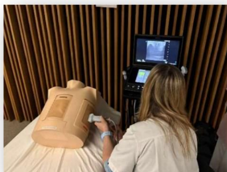
Ponctions sur fantôme