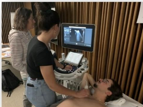
Acquisition des images normales sur volontaire.