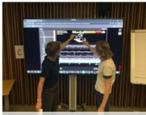
Cas interactifs en petits groupes sur écran permettant d'exercer l'intégration des examens ultrasonographiques dans des contextes cliniques.