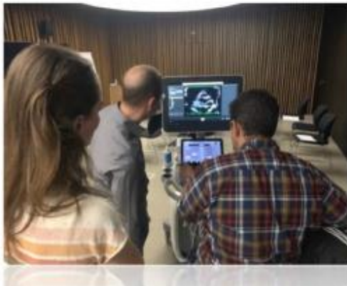
Enseignement de l'acquisition des images de bases normales sur des volontaires.