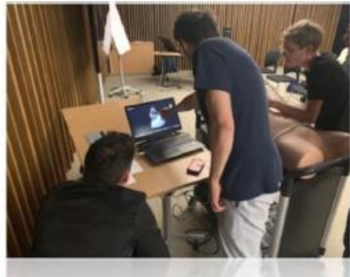
Enseignement des pathologies sur simulateurs haute-fidélité Vimedix®.